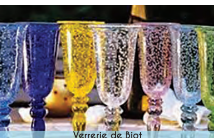
Verrerie de Biot