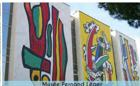
Musée Fernand Léger